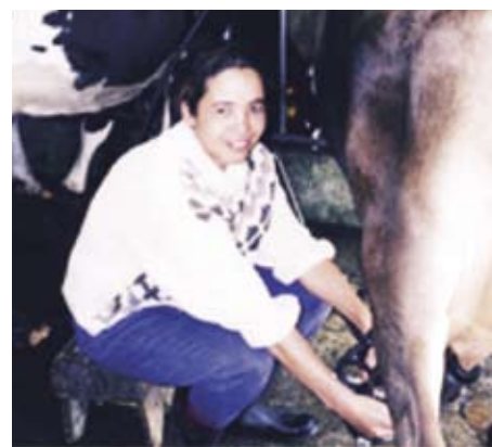
Ordeño en lechería artesanal

En la primera fase de implementación de la Ruta se ha trabajado en la identificación de atractivos turísticos, en la evaluación de las fincas lecheras y las plantas queseras; en la sensibilización de los productores y la organización y capacitación del grupo gestor. Asimismo, se han realizado diversas gestiones para la búsqueda de recursos de financiamiento, se participa en espacios de coordinación y promoción del turismo y se ha asistido a algunas ferias regionales. También, desde el año 2002, se celebra anualmente la Feria del Queso Turrialba, evento que ha contribuido a promover la ruta del queso.