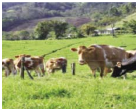
Hato de ganado típico de Santa Cruz

más de un siglo. El sistema de producción del queso ha sufrido pocos cambios en cuanto a la técnica, pero sí se han dado importantes mejoras en las razas de ganado (Jersey, Guernsey y Pardo Suizo), en los pastos, así como en la infraestructura de las lecherías y las plantas queseras. Se han remodelado los locales e introducido equipos de acero inoxidable, cámaras de frío, instalación de biodigestores y lagunas de oxidación en cumplimiento de las disposiciones sanitarias. Se estima que un 70% del queso fresco consumido a nivel nacional proviene de los alrededores del volcán Turrialba.