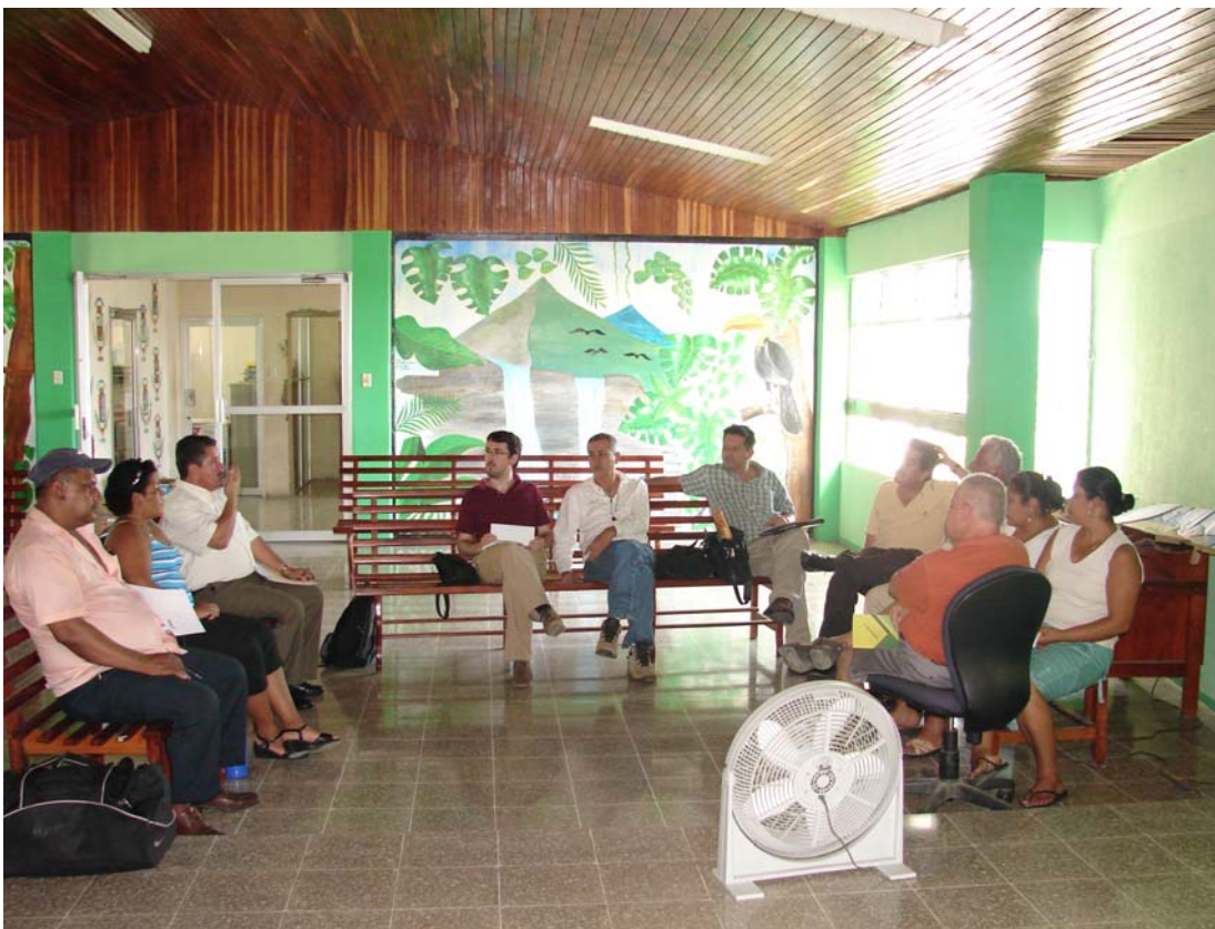
Foto 2. Visita de información y motivación a la Municipalidad de Golfito