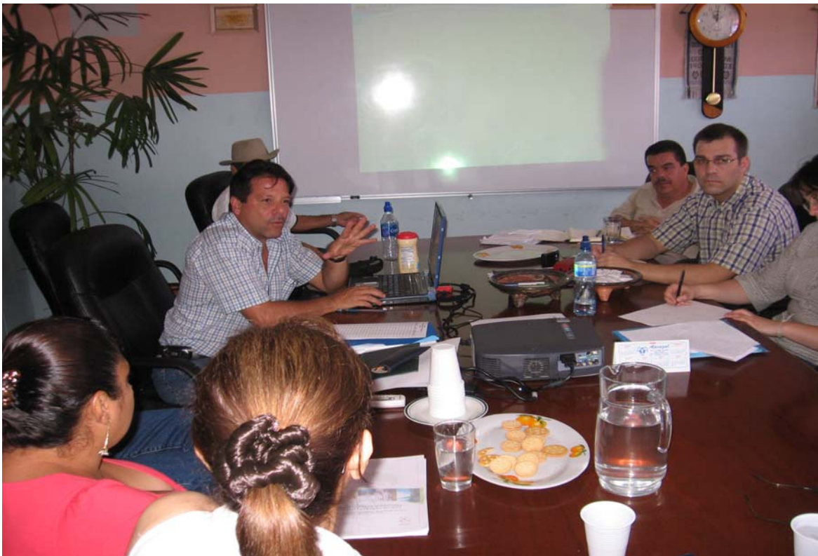
Foto 10. Análisis del PEDER del GAT-Sur, con Gerente y Especialista en Planificación del GAT de Terra Das Mariñas, Galicia, España