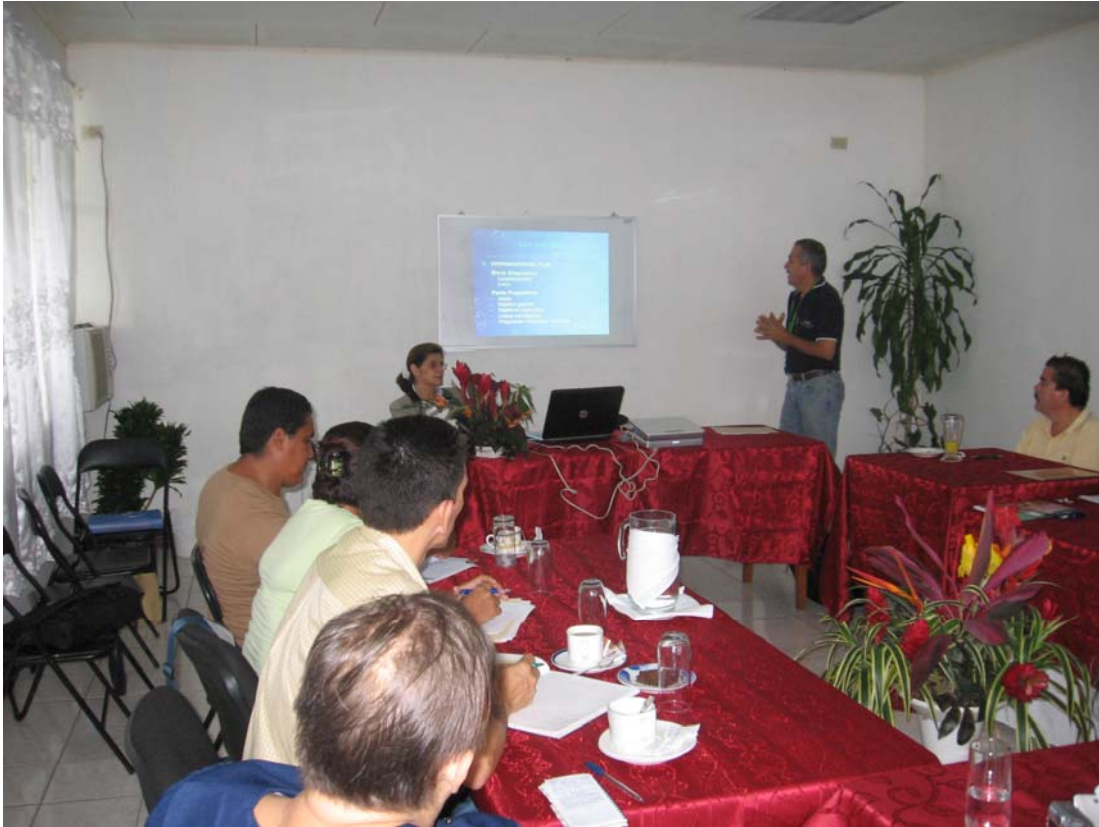
Foto 7. Sesiones de trabajo y charlas técnicas, bases para la construcción del PEDER