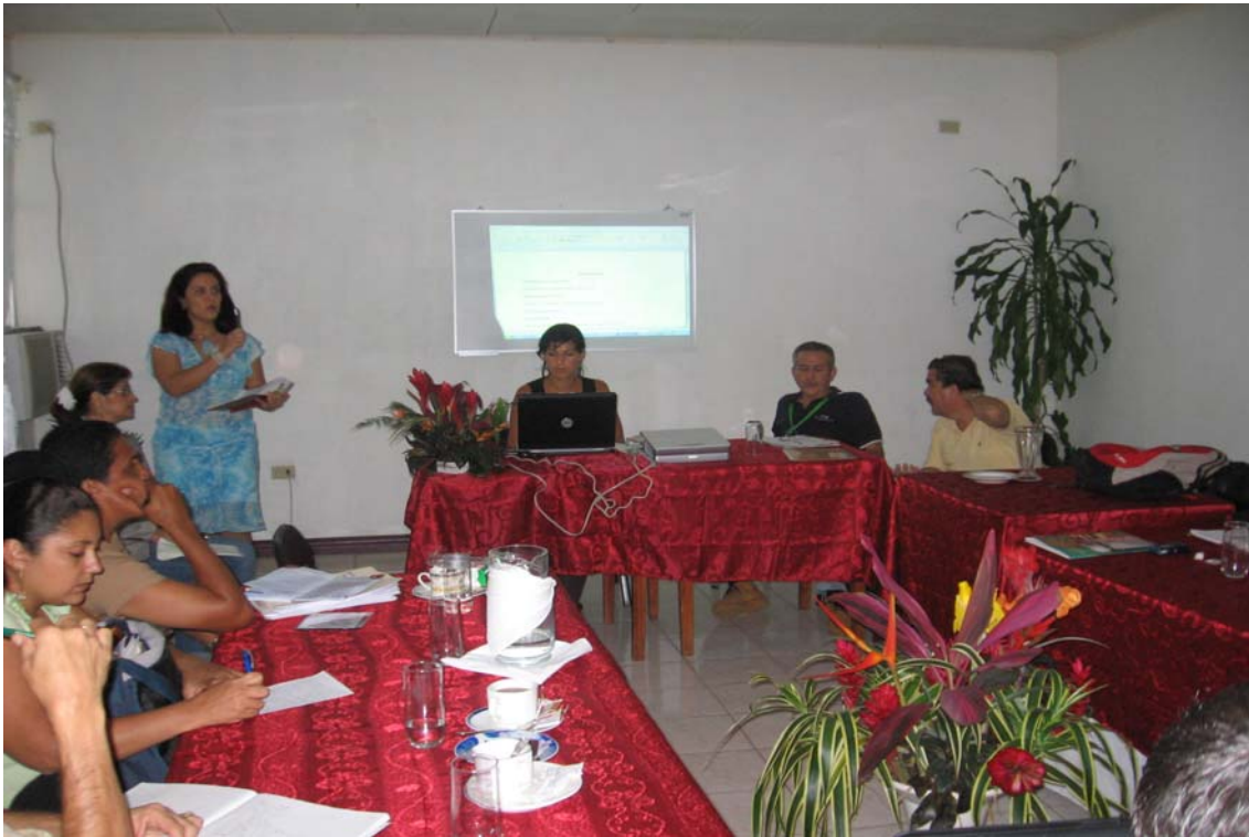
Foto 5: Presidenta del GAT, conduciendo el proceso de construcción del PEDER