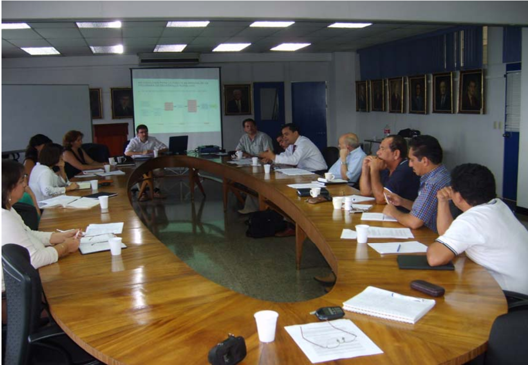
Foto 1. Sesiones de información y planificación para la ejecución del Proyecto PDR-EXPIDER II