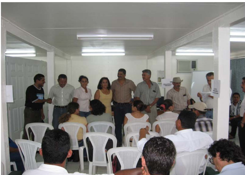
Foto 4. Junta Directiva del GAT-Sur