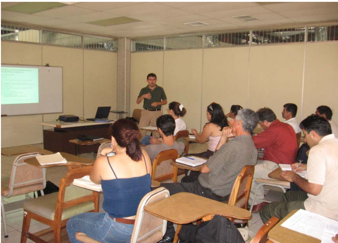
Foto 8. Charlas técnicas de expertos de DEVALAR