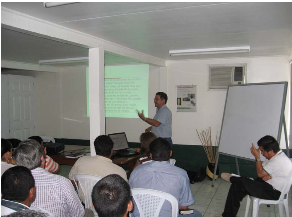
Foto 3. Charla de motivación de funcionarios del Equipo PDR-EXPIDER II, durante constitución del GAT-Sur