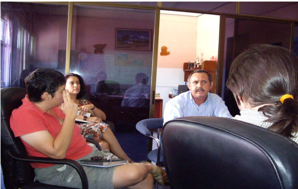
Foto 6. Representantes de JUDESUR, comprometiendo su apoyo al GAT-Sur